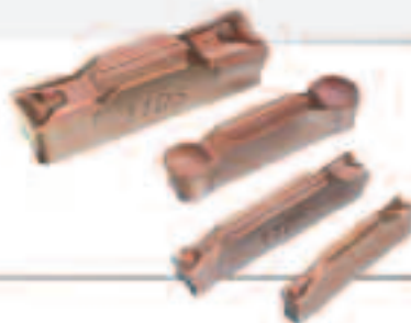
Nova classe GC1125